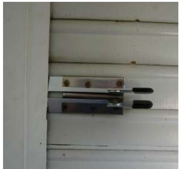
Einbruchsicherung für Rollläden